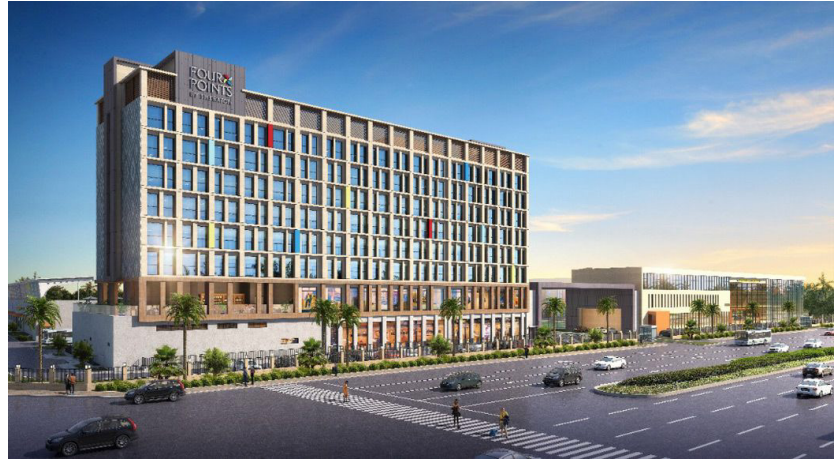
OUZO HOTEL / LİBYA